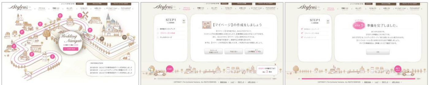
新郎新婦向け結婚準備アプリケーション「Styleus (スタイラス)」のマイページ画面。結婚式までに必要な 42 の準備項目をゲーム感覚で楽しく進められます。