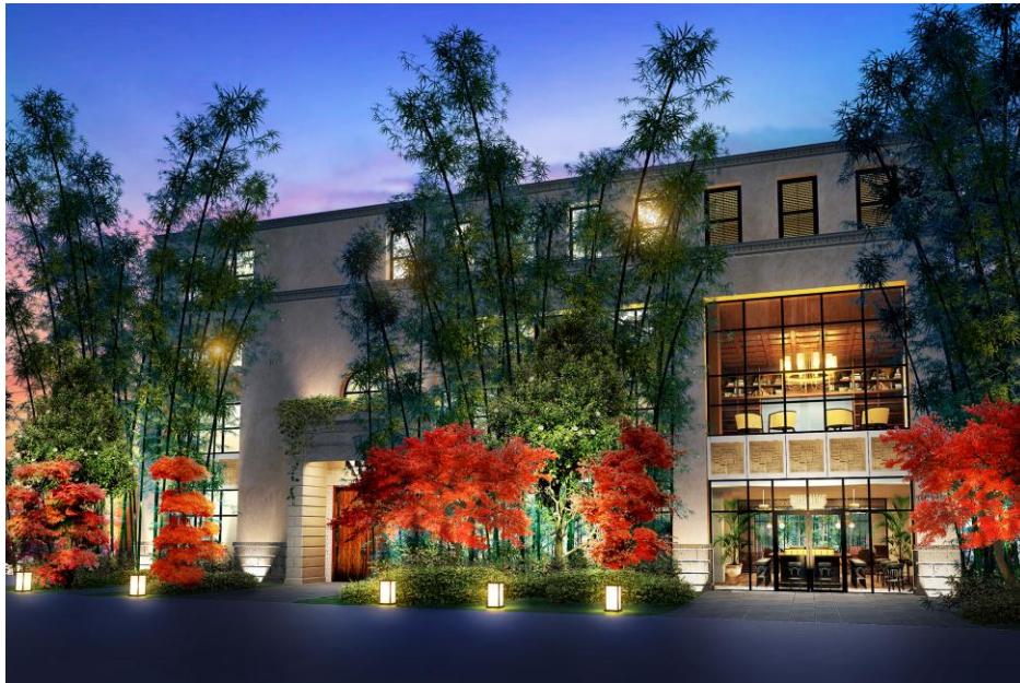
「THE CLASSICA OMOTESANDO ザ クラシカ表参道」完成イメージ（外観）