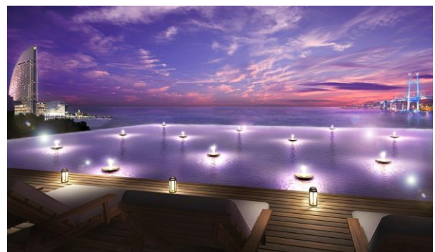
横浜の海やランドマークが一望できるルーフガーデン

古くは船着き場として多くの外国船が出入りした歴史ある開港後の町「横浜」を余すことなく堪能できるよう、建物全体を「外国船」というキーワードで構成し、景色との調和を意識して設計いたしました。横浜ベイブリッジ、赤レンガ倉庫、大栈橋など横浜のランドマークを一望できるパノラマビューをお楽しみいただける、圧倒的なスケール感が魅力です。