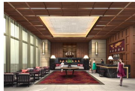
完成イメージ（写真左：外観、右上：チャペル、右下：1Fロビー） http://www.grandoriental.jp/

『グランドオリエンタルみなとみらい』が位置する「みなとみらい21地区」は、「海」と「空」、そして、横浜らしさの象徴でもある「港」が一度に楽しめるエリアとして、40年以上の年月をかけて景観を守りながら開発が進められてきた場所。横浜ベイブリッジ、赤レンガ倉庫、大栈橋など、横浜のランドマークを堪能できる絶好のロケーションにあります。また、2013年3月に東急東横線・東京メトロ副都心線の相互直通運転が開始したことにより、これまで以上に広域からの来街者が見込まれるエリアであり、『グランドオリエンタルみなとみらい』もその中の一角として着工当初から多くのメディアで注目を集めてまいりました。